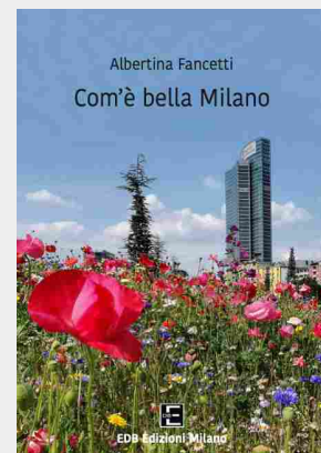
Com'è bella Milano di Albertina Fancetti EDB Edizioni

Tra gli obiettivi da perseguire quello di definire le aree di intervento, identificando gli eventuali ambiti su cui è necessario un potenziamento delle attività; e poi individuare i nuovi bisogni e le risorse, supportando la capacità degli attori